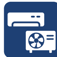
TÉCNOLÓGIA 3D DC EN MODELOS INVERTER