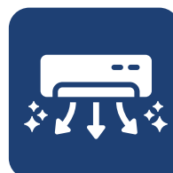
MODOS AUTO LIMPIEZA