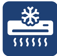
ALTA EFECTIVIDAD DE ENFRIAMIENTO