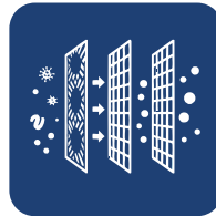
FILTRO DE ALTA DENSIDAD